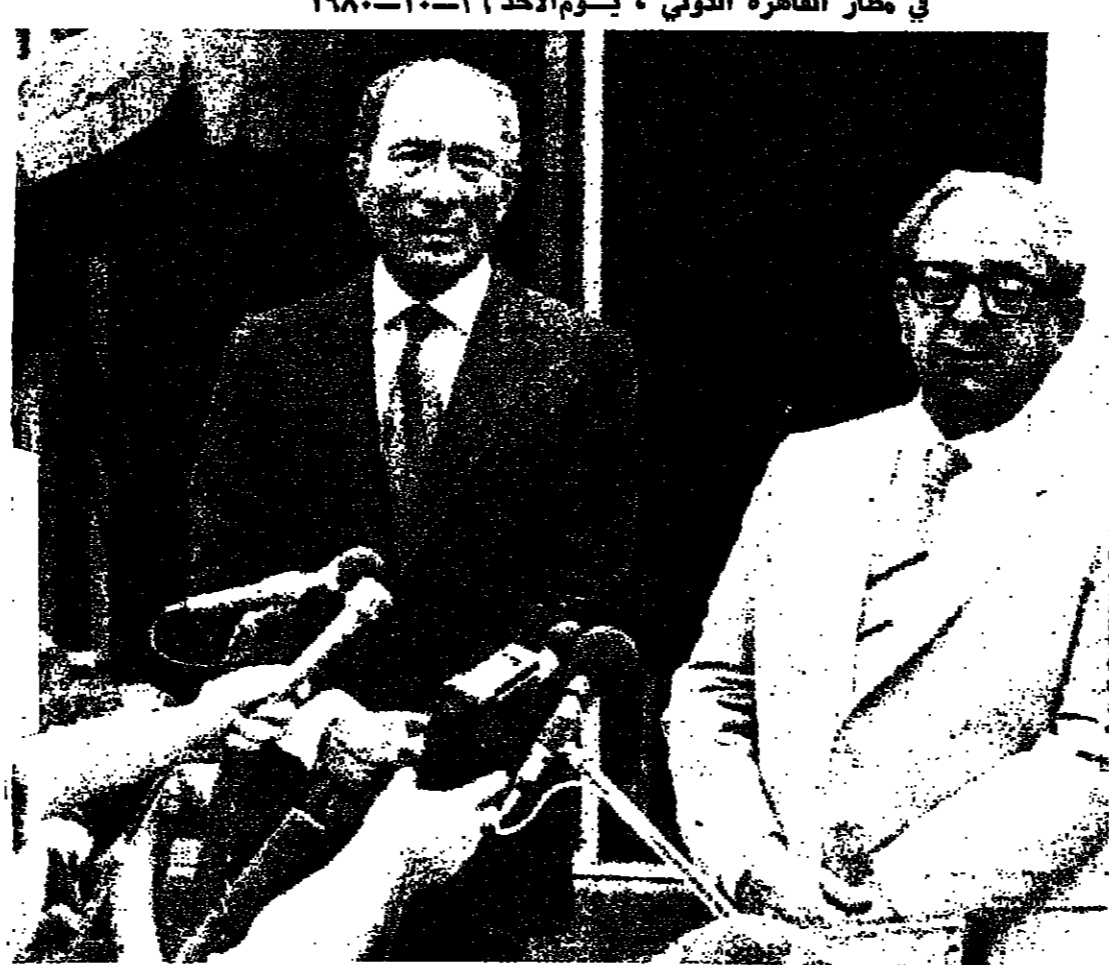
الرئيسان ناسون والسادات اثناء المؤتمر الصحفي الذي عقده في ختام جولة المحادثات الثانية في ميت ابو الكوم .